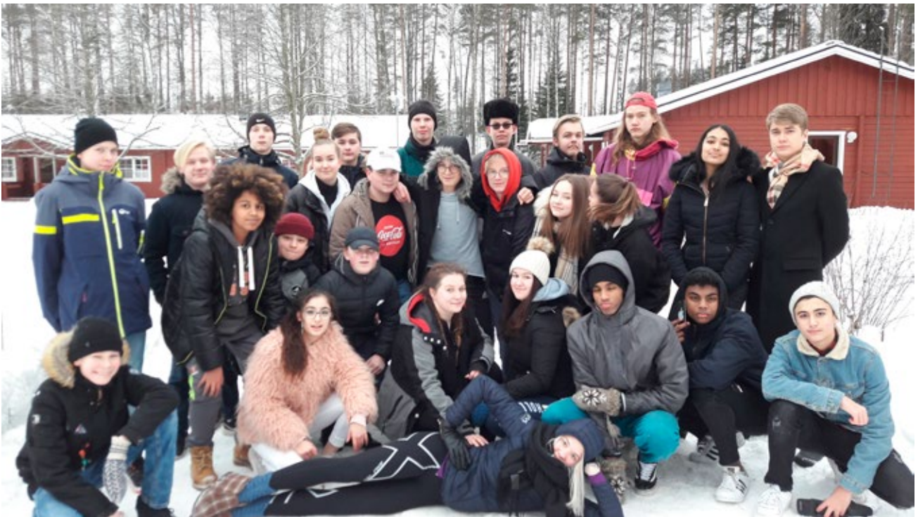
Vantaan nuorisovaltuusto 2018–2019.

Kaupungin päätöksentekoon lapset ja nuoret voivat vaikuttaa muun muassa nuorisovaltuuston kautta. Nuorisovaltuusto on 13–18-vuotiaiden nuorten vaikuttajaryhmä, johon vaalitaan vaaleilla kahdeksi vuodeksi kerrallaan 20 varsinaista jäsentä ja 10 varajäsentä. Kaikilla 13–18-vuotiailla vantaalaisilla on oikeus asettua ehdolle ja äänestää vaaleissa. Nuorisovaltuusto toimii nuorten edunvalvojana ja nostaa esille nuorille tärkeitä asioita.