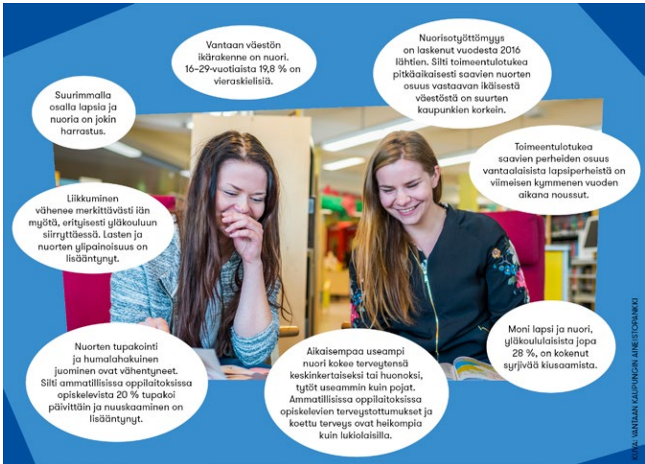
Kuva 1. tietoa vantaalaisista lapsista ja nuorista sekä heidän hyvinvoinnistaan

Hyvinvointierot ovat suuria eri ryhmien välillä. Esimerkiksi ulkomailla syntyneillä, toimintarajoitteilla tai kodin ulkopuolelle sijoitetuilla nuorilla on huomattavasti enemmän hyvinvoinnin haasteita kuin muilla nuorilla. Huolestuttavaa on esimerkiksi se, että maahanmuuttajanuorista (15–29 v.) lähes joka viidennen voidaan arvioida olevan syrjäytymisvaarassa. Maahanmuuttajataustaisten lasten ja nuorten hyvinvoinnista löytyy enemmän tietoa monikulttuurisuussuunnitelmasta.