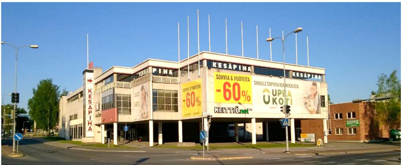
Tontti Martinkyläntien ja Riihitontuntien risteyksestä.