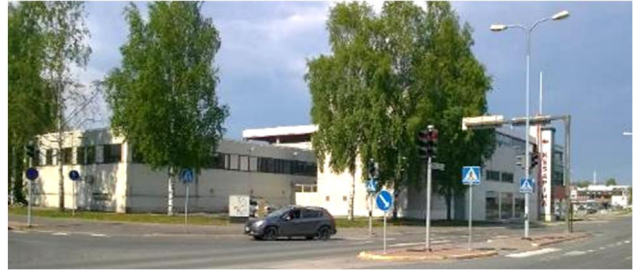
Tontti Riihimiehentien risteyksestä.

Kaavan hyväksyjä on kaupunginvaltuusto. Kaavan voimaantulo kuulutetaan kaupungin verkkosivuilla.