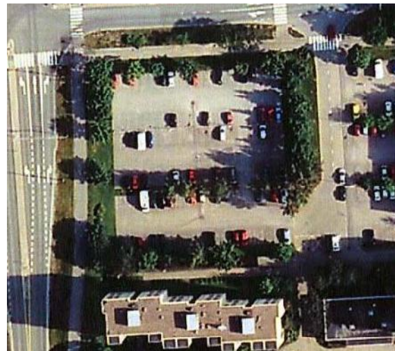
Ortoilmakuva vuodelta 2009.