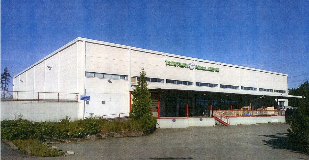
Teollisuushalli, Riihimiehentie 8.