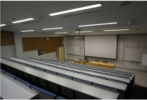
Varia Talvikkitien toimipiste (Koivukylä)